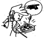
Appeler les pompiers