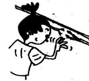
Toucher des fils électriques dénudés