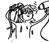
Utiliser un appareil électrique quand on est mouillé