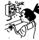
Couper le courant

A la maison, l'électricité peut provoquer des accidents. Barre les situations dans lesquelles il y a un danger :